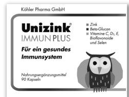
Zink, Beta-Glucan, Vitamine C, D 3 , E, Bioflavonoide und Selen