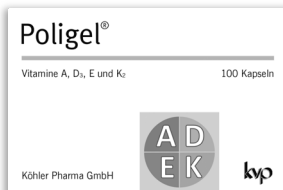
Vitamine A, D 3 , E + K 2