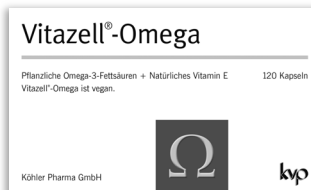
Pflanzliche Omega-3-Fettsäuren + natürliches Vitamin E