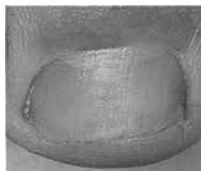
Nach der Behandlung