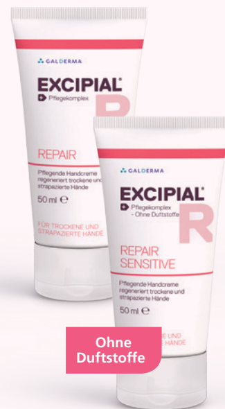
je 50 ml