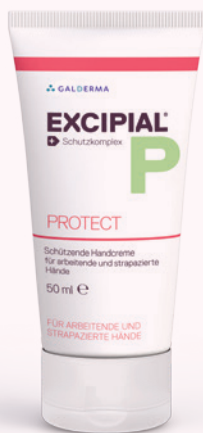
50 ml und 500 ml