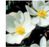
kanad. Blutwurz (Sanguinaria):

bei Stimmungsschwankungen, innerer Unruhe, Kopfschmerzen