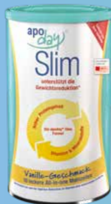
450 g Dose Vanille PZN 10123815

Probieren Sie auch die leckeren süßen All-in-one Mahlzeiten in den Geschmacksrichtungen: Vanille und Schoko.