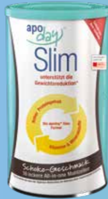
450 g Dose Schoko PZN 10123821

Mit wenigen Zutaten können Sie Vanille und Schoko geschmacklich abwandeln. Rezepte dazu finden Sie unter www.apoday-slim.de .